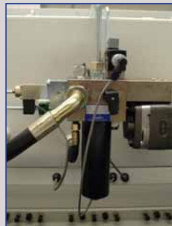
Impianto idraulico Hoerbiger, la miglior qualità nei gruppi idraulici per presse piegatrici.