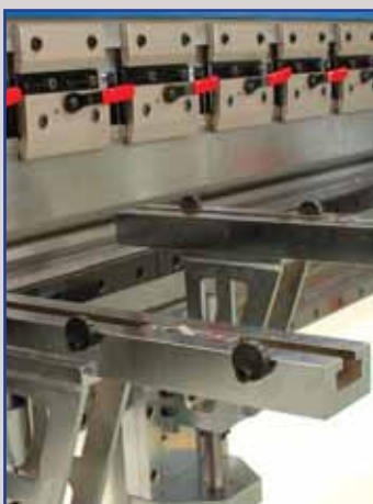
Utensili attacco "Promecam", Intermediari con bloccaggio semiautomatico e pratici supporti frontali in acciaio regolabili e scorrevoli su guide lineari.