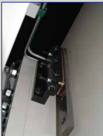
Doppia guida, permette di tenere guidato il pestone per tutta la corsa della macchina.