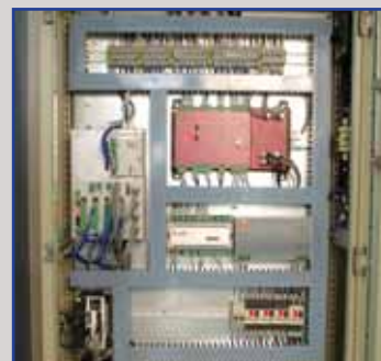
Quadro elettrico con componenti Siemens, Panasonic e Telemecanique