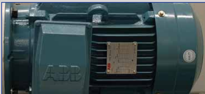
Motori ABB, leader nella costruzione di motori ad alta affidabilità, il massimo nelle prestazioni.