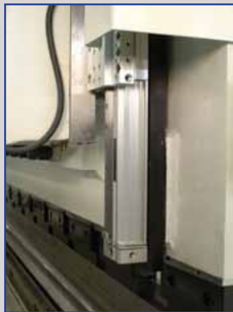
Righe ottiche di alta qualità HEIDENHAIN, per una perfetta precisione di piegatura.