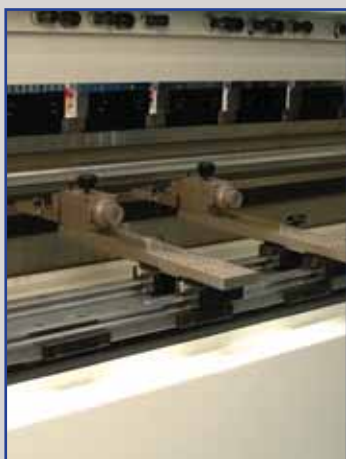
Dettaglio del registro posteriore, spostamento manuale o automatico (Z1, Z2 e X3 optional) dei fermi su doppia guida lineare, per un movimento preciso altamente funzionale.