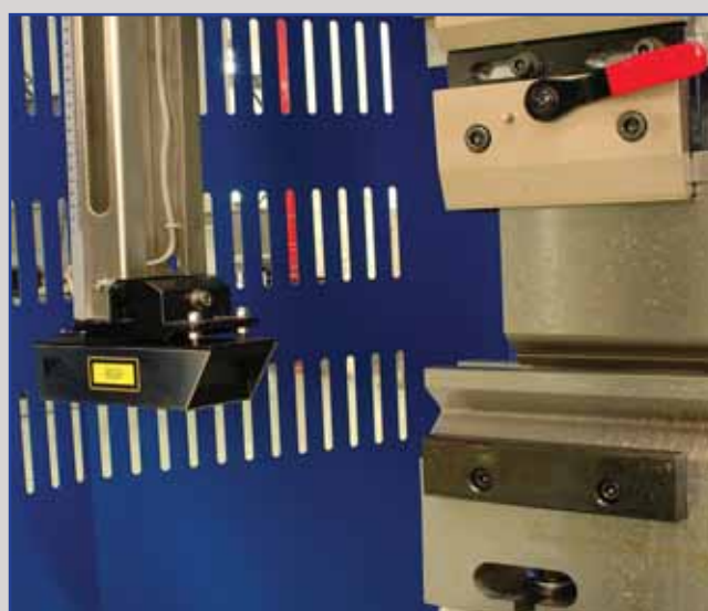
Fotocellule di sicurezza lasersafe

Il settore della lamiera e' sempre piu' esigente. Le macchine per la lavorazione della lamiera vicla sono quanto di meglio possa offrire oggi il mercato in termini di qualita' ed affidabilita' le piegatrici sono costruite in modo robusto ed utilizzano i migliori componenti per la massima funzionalita'.