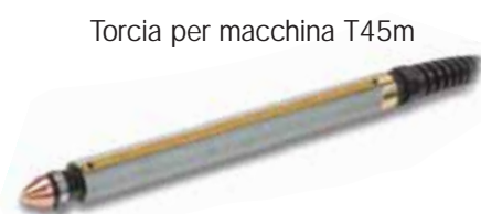
Torcia per macchina T45m