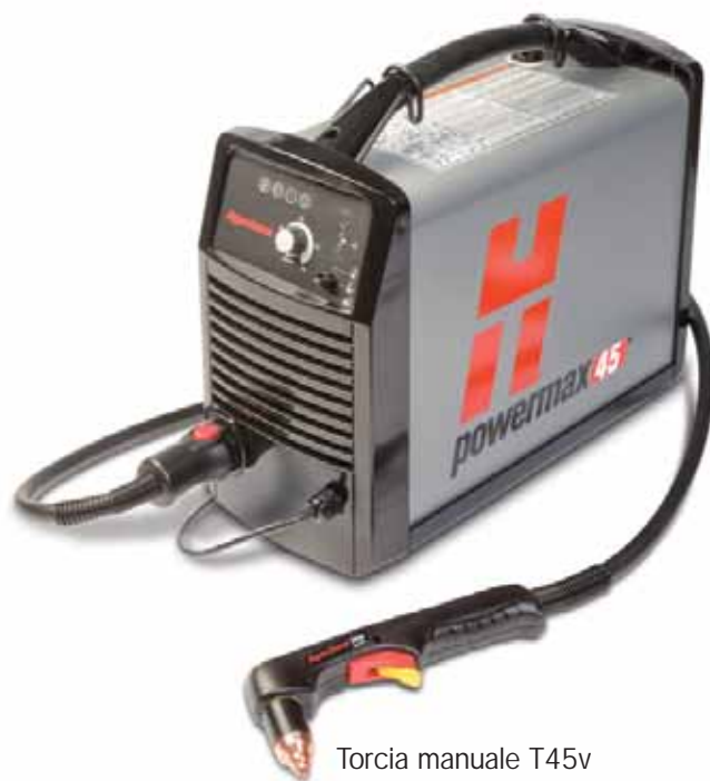
Torcia manuale T45v